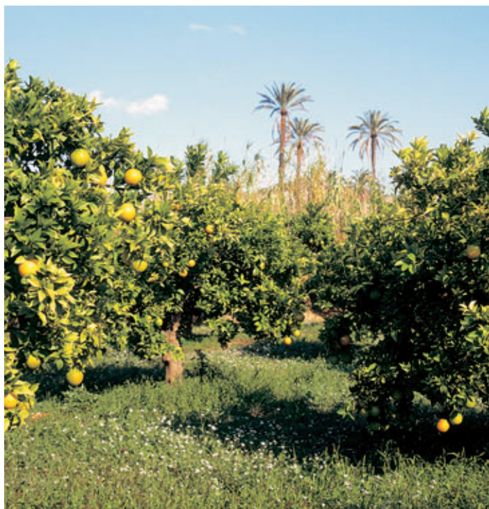
Naranjos en la huerta murciana.

La Región de Murcia hasta los años sesenta del siglo xx se dedicaba casi exclusivamente a la actividad agrícola.